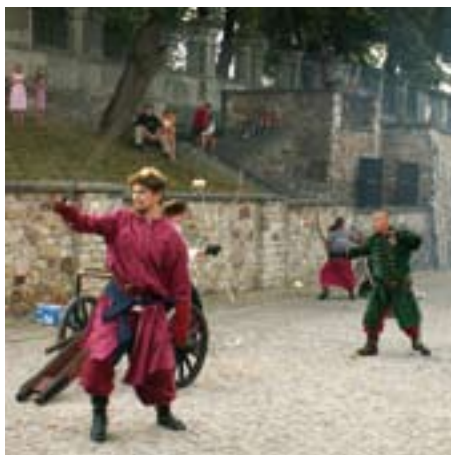
Turniej rycerski, Opatów

grudzień 2010 , Lanckorona, woj. małopolskie