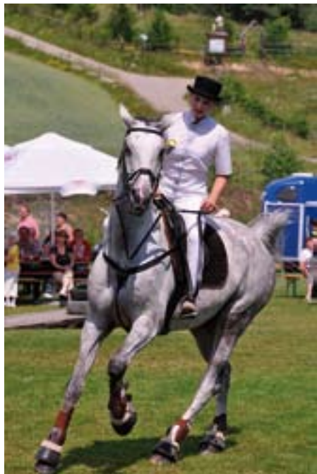
Targi Końskie, Lutowiska

(13) 469 72 97, biuro@fundacja.bieszczady.pl, www.fundacja.bieszczady.pl