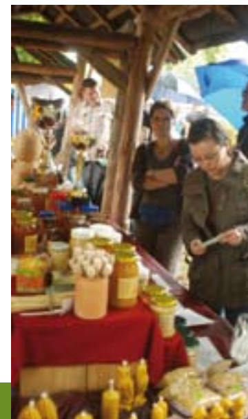
Biesiada Miodowa, Kurowo

www.bialowieza.gmina.pl/artukul,249.html